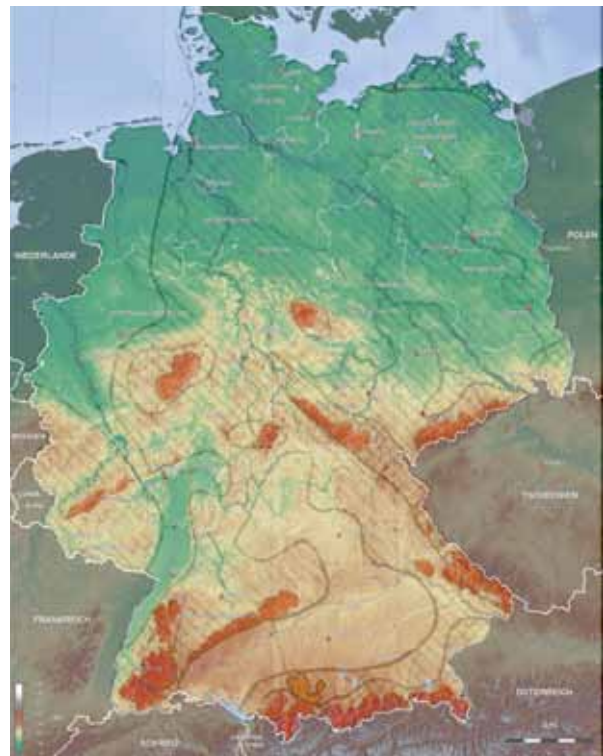
Schneelastverteilung in Deutschland

Um Schneelastschäden zu vermeiden, ist unbedingt auf die statisch ausreichende Dimensionierung der Dachhaken zu achten. Gerade bei den Schneelasten sind die Unterschiede z.B. zwischen Regionen mit normalen Belastungen (z.B. 0,55 bis 0,75 kN/m 2 ) und erhöhten Belastungen (bis über 5kN/m 2 in höher gelegenen Standorten) sehr groß. Wirtschaftliche und sichere Lösungen entstehen nur dann, wenn Montagesysteme und Gebäude-Unterkonstruktion optimal aufeinander abgestimmt sind. Insbesondere mit Einführung der neuen Normung bezüglich Wind- und Schneelasten (Windlasten gemäß DIN 1055, Teil 4 (03/2005) und Eurocode 1 (06/2002), Schneelasten gemäß DIN 1055, Teil 5 (06/2005)) sind regional die Unterschiede der Belastungen wesentlich größer geworden. In Gebieten mit großen Schneelasten sind zur gleichmäßigen Dachauslastung grundsätzlich Haken auf jedem Sparren zu empfehlen. Bei großen Schneelasten sind Blech-Ersatzziegel generell zu empfehlen, da die Dachhaken je nach statischer Auslegung die Ziegel belasten können.