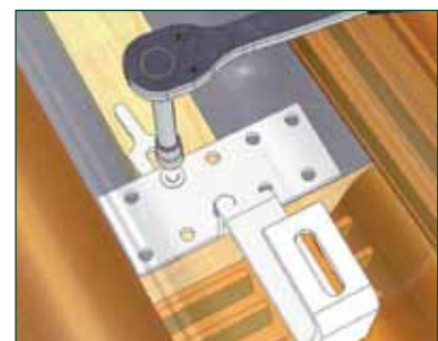
Montage mit Alu-Unterlegplatten