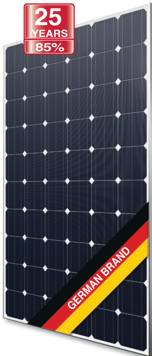
Abb. ähnlich 60M156DE160215A

Hochwertige Anschlussdose und Steckersysteme